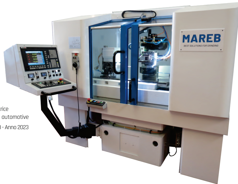
Macchina CNC 5 assi affilatrice eliche e rettificatrice per fori e piani particolari automotive Mod. AFF.RETT.01 - Matr.060 - Anno 2023