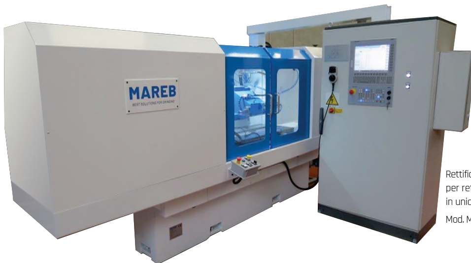
Rettificatrice 4 assi su base Lizzini per rettifica completa particolari in unica presa Mod. Ma. IE - Anno 2022

Mareb è specializzata nel retrofit di macchine rettificatrici, in particolare da interni, in tondo e tangenziali. Da anni l'azienda di Mazzano è all'avanguardia nella progettazione e realizzazione di: mandrini per rettifica sia da interni che da esterni, costruiti su specifica del cliente, sia di tipo a cuscinetti che idrostatici; transfer e macchine speciali; progettazione e costruzione di prodotti legati al mondo della rettifica. Per tutta la produzione Mareb è in grado di fornire sia prodotti standard che secondo specifiche del cliente.