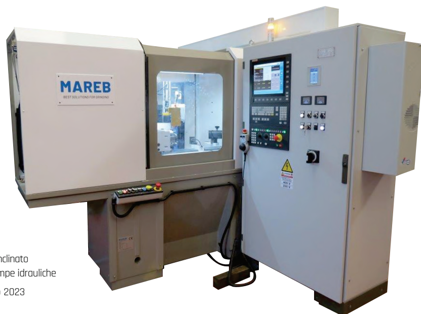
Rettificatrice 2 assi su base Tschudin a tuffo inclinato per rettifica particolari pompe idrauliche Mod. TSCH.MAR.0 - Anno 2023

Mareb da anni si occupa di retrofit di macchine rettificatrici da interni, in tondo e tangenziali. Tramite l'assistenza post vendita, inoltre, fornisce ai propri clienti un servizio rapido ed eseguito da personale qualificato.